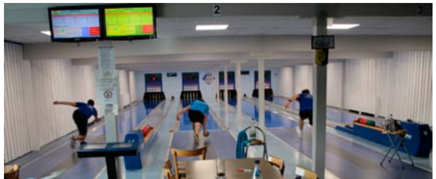
SKA Rimbach II vs. SG Laudenbach I

Bei Redaktionsschluss dieser Ausgabe waren acht Spieltage absolviert, und die SKA-Teams schlagen sich unterschiedlich: Die erste Mannschaft belegt in der Landesliga 1 Rang zwei, während die zweite Garnitur sich in der Bezirksliga Nord 2 als Vorletzter noch schwer tut. Die „Dritte“ belegt in der Bezirksliga Nord 5 Rang