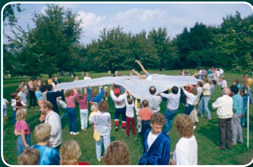
Spielfest Sportkreis Bergstraße