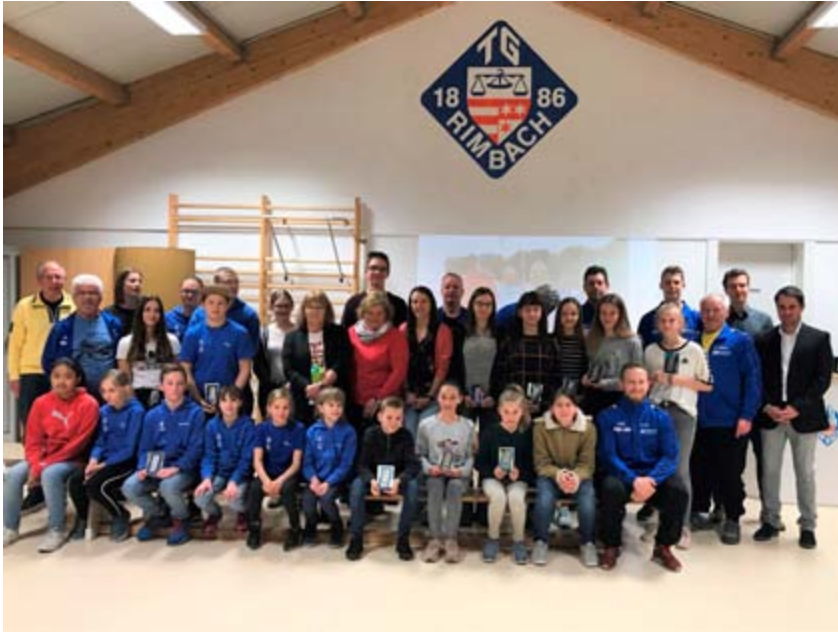
Leistungsträger aus dem Vorjahr