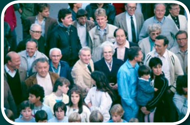
Auf dem Marktplatz