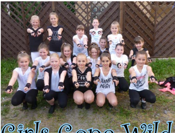
Girls Gone Wild