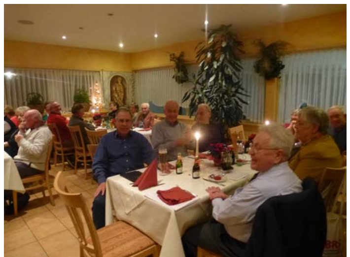
...in der Vereinsgaststätte „Felice“