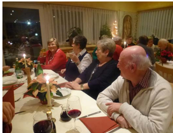
...der Herzsportgruppe 2014...