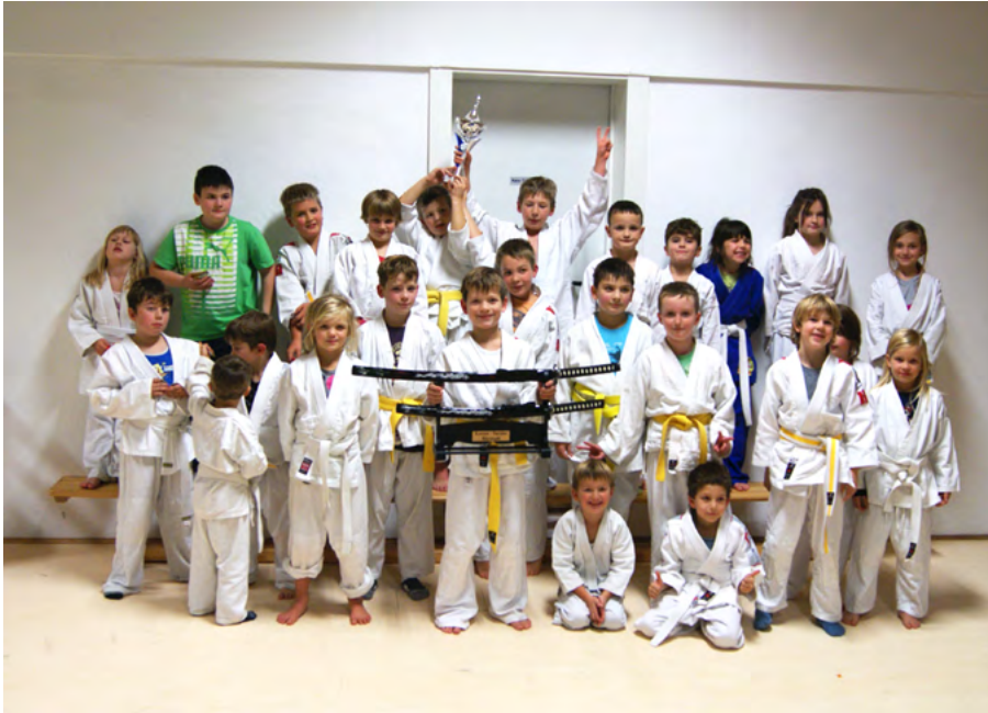
Der Judonachwuchs der TG Rimbach freute sich über die „Schwerter der Samurai“, die Siegetrophäe des Bürstädter Katana-Turniers.

Auch als Zweitplatzierter kann man mit einer großen Trophäe nach Hause kommen. Das bewies jetzt der Judo-Nachwuchs der TG Rimbach. Weil der eigentliche Sieger des Bürstädter Katana-Turniers bei der Pokalübergabe nicht mehr da war, erhielten die Rimbacher den Cup und die Wandertrophäe in Form zweier Samurai-Schwerter. Ebenfalls tolle Ergebnisse erzielte die jungen Kämpfer beim „Mäuseturnier“ in Siershahn.