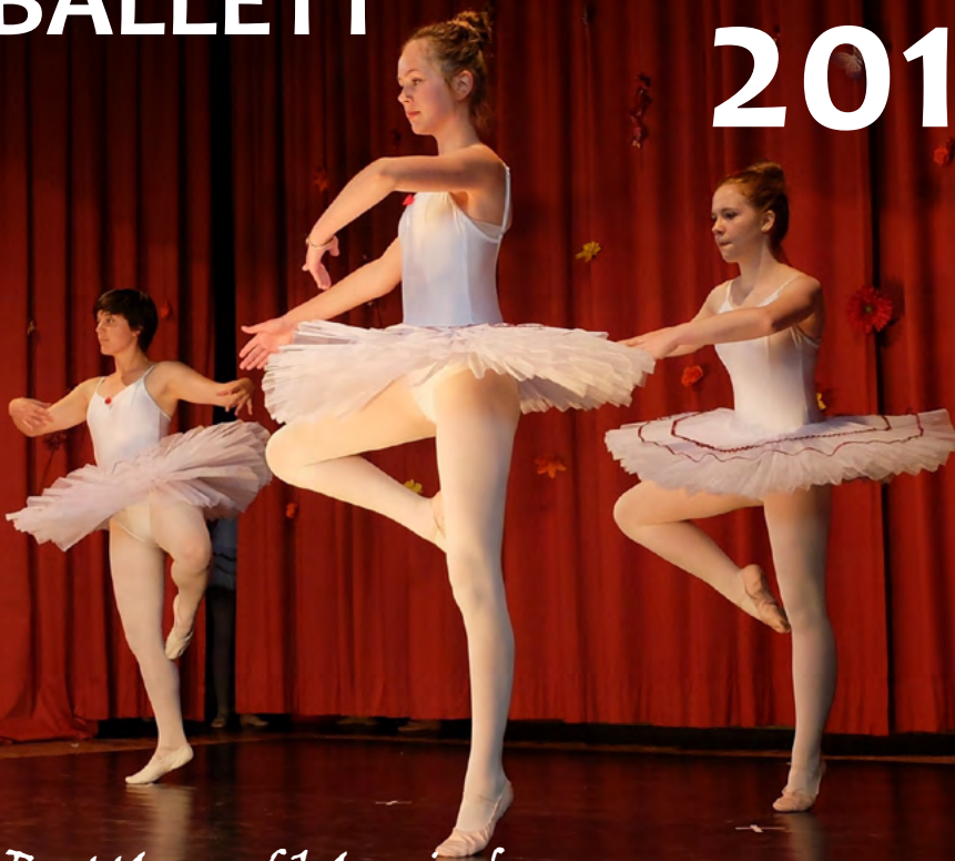
Battle auf klassisch