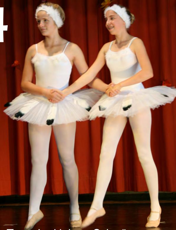
Tanz der kleinen Schwäne