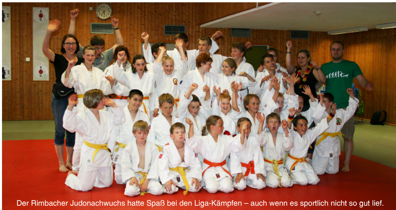
Der Rimbacher Judonachwuchs hatte Spaß bei den Liga-Kämpfen – auch wenn es sportlich nicht so gut lief.